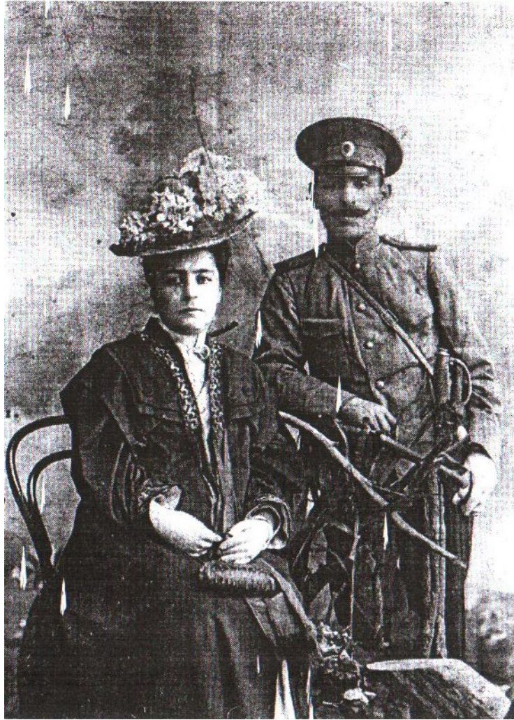
გენერალი გიორგი მაზნიაშვილი მეუღლესთან ერთად